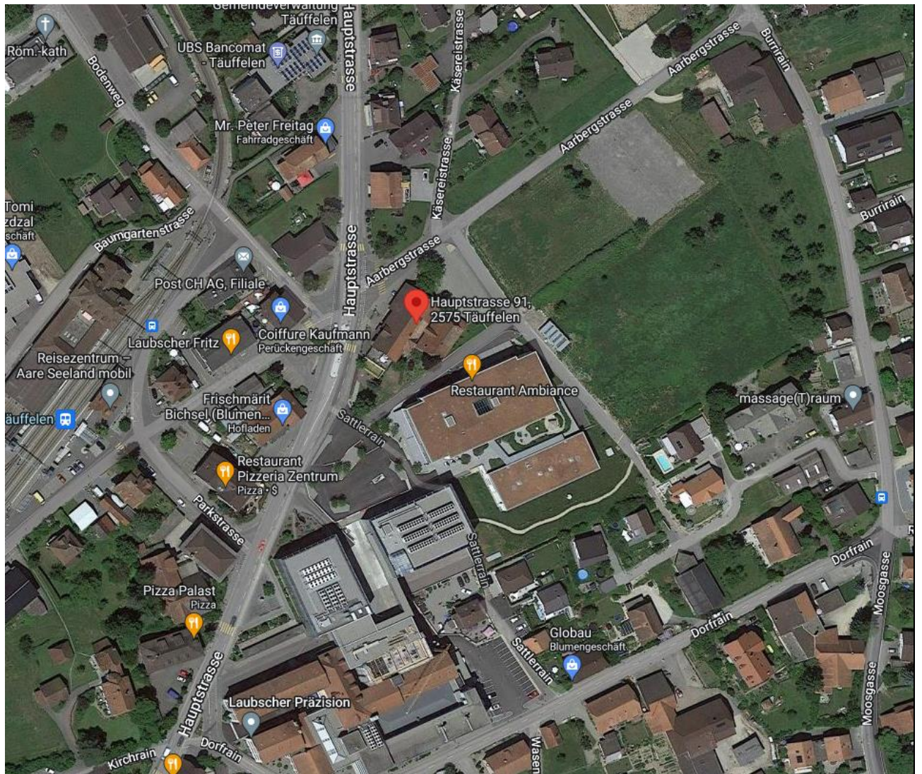
Standort des ehemaligen Restaurant Laubscher.